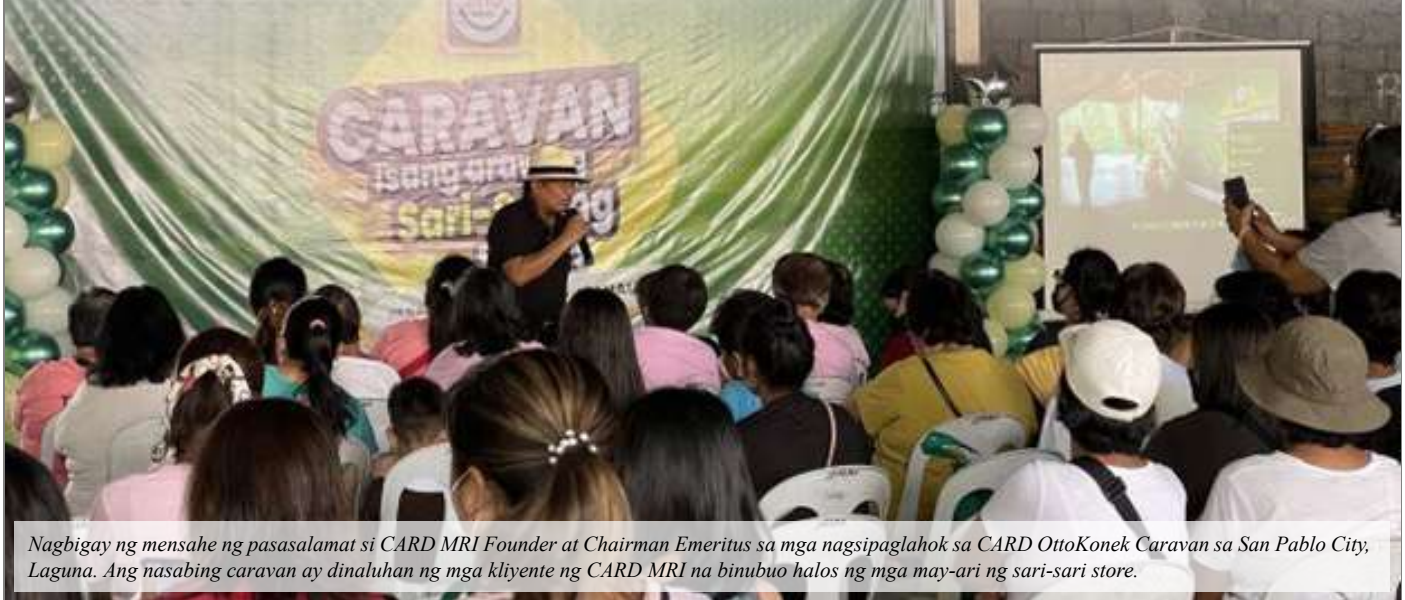
Nagbigay ng mensahe ng pasasalamat si CARD MRI Founder at Chairman Emeritus sa mga nagsipaglahok sa CARD OttoKonek Caravan sa San Pablo City, Laguna. Ang nasabing caravan ay dinaluhan ng mga kliyente ng CARD MRI na binubuo halos ng mga may-ari ng sari-sari store.

Sagisag na ng ating bansa ang kaliwa't kanang sari-sari store sa ating lansangan. Ito na ang naging pangkabuhayan ng marami nating kababayan. Ngunit sa pagsulpot ng mini-marts sa mga bara-barangay, higit nang naapektuhan ang may-ari ng mga maliliit na tindahan.