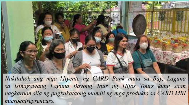
Nakilahok ang mga kliyente ng CARD Bank mula sa Bay, Laguna sa isinagawang Laguna Bayong Tour ng Hijos Tours kung saan nagkaroon sila ng pagkakataong mamili ng mga produkto sa CARD MRI microentrepreneurs.

ng San Pablo City, Calauan, Los Baños, Victoria, at Sta. Cruz. Nagbibigay rin ang tour na ito nang mas malalim na impormasyon sa mga manlalakbay tungkol sa mga produktong ibinebenta ng mga kliyente ng CARD at kung paano nila napananatiling matatag ang kanilang negosyo.