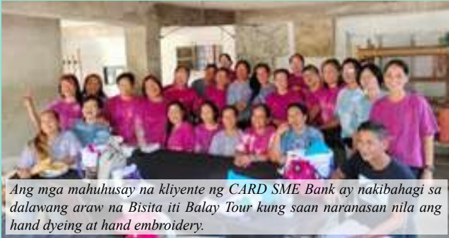
Ang mga mahuhusay na kliyente ng CARD SME Bank ay nakibahagi sa dalawang araw na Bisita iti Balay Tour kung saan naranasan nila ang hand dyeing at hand embroidery.

mayamang kasaysayan at makulay na kultura ng Norte, partikular na ang Vigan City sa Ilocos Sur at Peñarrubia sa Abra. Ang makasaysayang kwento nito ay nagpapakita rin ng kaugalian ng CARD MRI at ng ating mga pamana bilang Pilipino.